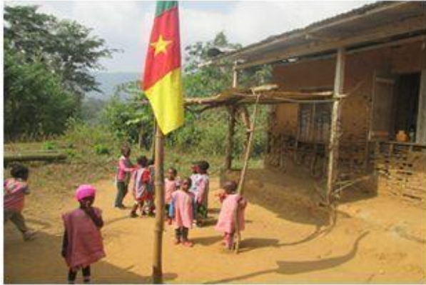
Figure 3: Nursery school of Kukum

► La première sélection se fait dans les familles ayant des enfants fréquentant l'école primaire du village.