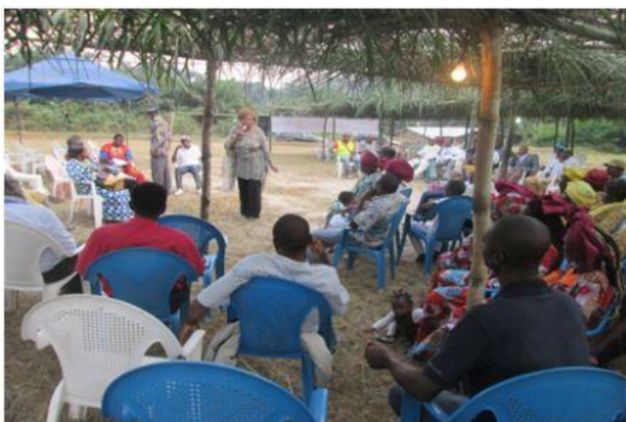
Figure 2 : La présidente de ASAFE parle aux populations de Kukum