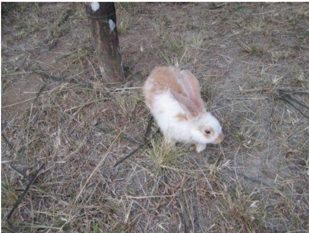
Figure 1: lapin dans le projet "Riche Ensemble" à KuKum