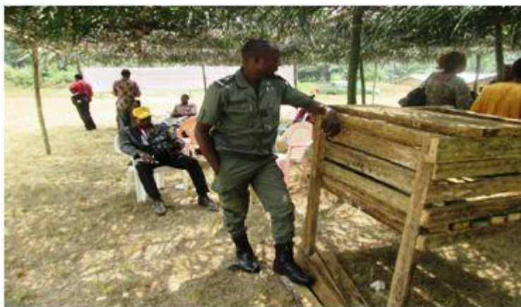
Figure 7: A finished rabbit warren

Utiliser des matériaux locaux. A Kukum nous avons utilisé du bois et du bambou pour les mangeoires et les abreuvoirs.