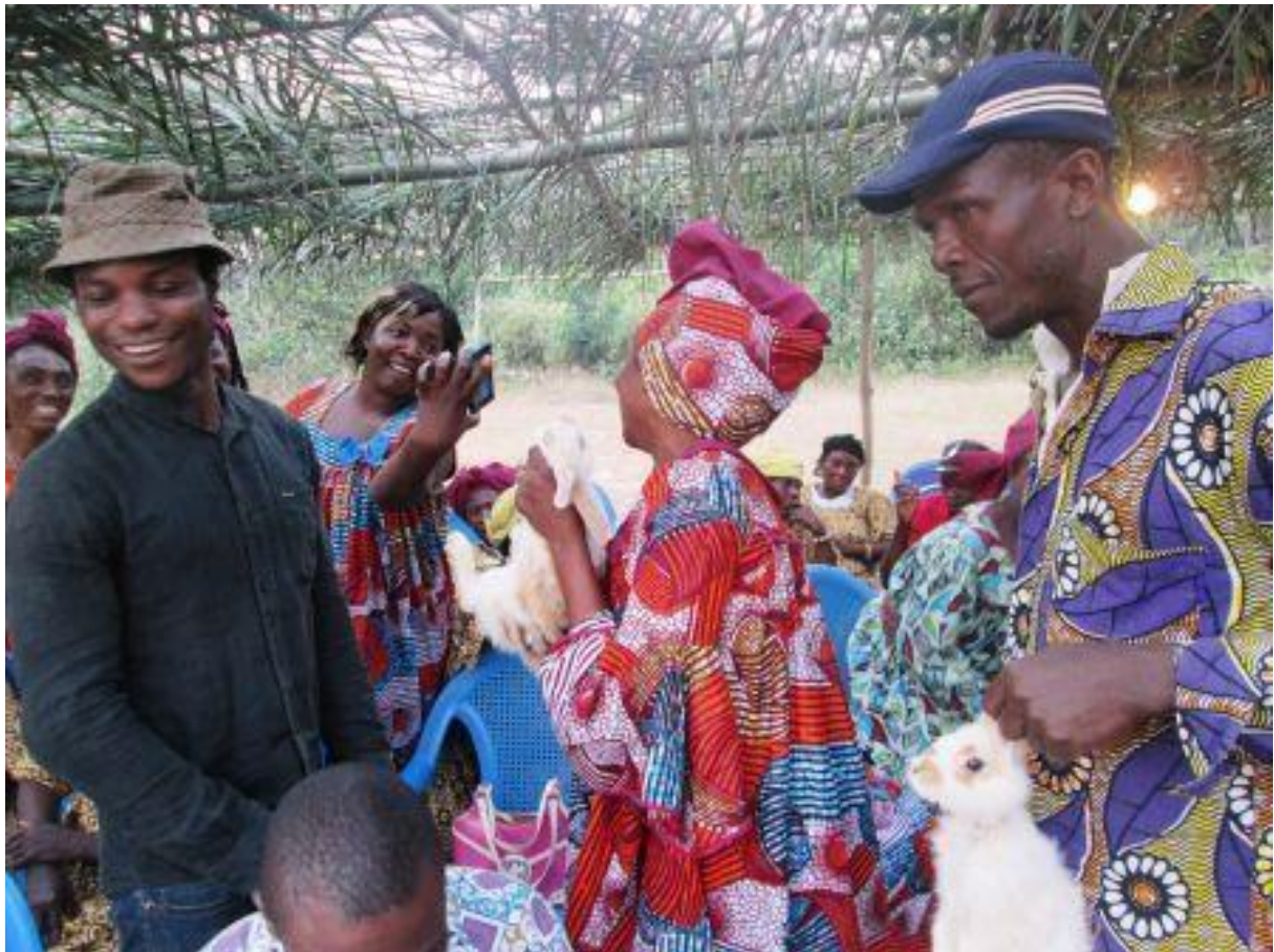
Figure 8: expression de joie des populations de KuKum

En conclusion un smart phone contenant les modules de formation est remis au coordinateur local du projet. Les problèmes rencontrés dans la pratique quotidienne recevront des réponses par SMS du coordonnateur ainsi que des autres membres du réseau.