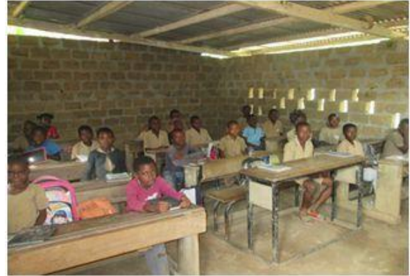
Figure 4: primary school of Kukum